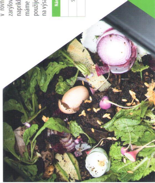
Kompostovanie v záhradných kompostéroch

Všetky tieto produkty budú predávané online na adrese: www.steberg.sk/kompestry/