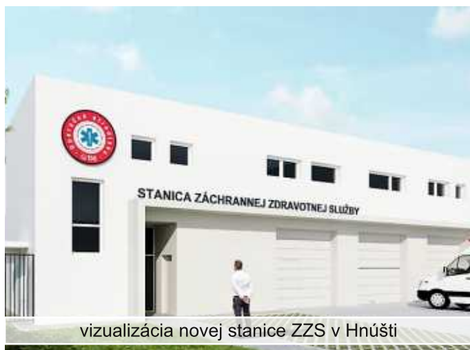
vizualizácia novej stanice ZZS v Hnúšti

Mesto Hnúšťa bolo zaradené do zoznamu miest určených na výstavbu a obnovu staníc záchranej zdravotnej služby (ďalej len "ZZS") na základe vypracovanej analýzy optimalizácie siete ZZS. Kritériom výberu lokalít boli nasledovné parametre udržateľnosti: stabilita daného miesta, vyťaženosť stanice (priemerný čistý čas strávený vo výjazde za 24 hodín), zastupiteľnosť stanice (podiel výjazdov posádky v jej spádovej oblasti). Na základe týchto kritérií nás Operačné stredisko záchranej zdravotnej služby oslovilo o spoluprácu pri hľadaní vhodných pozemkov pre výstavbu jednoposádkovej stanice ZZS. Mesto Hnúšťa disponuje vhodnými pozemkami, ktoré následne Operačnému stredisku ZZS predložilo a zároveň pozvalo na obhliadku a rokovanie. O výsledku rokovaní vás budeme informovať v nasledovných číslach.