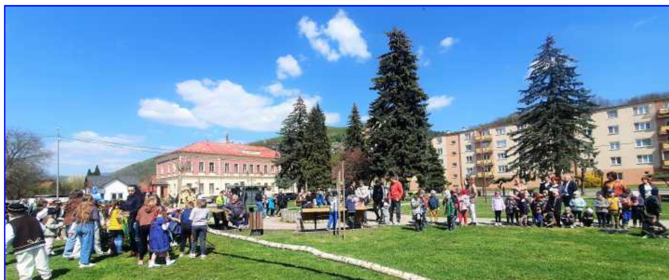
Máj máj máj zelený, pod oblôčkom sadený ...

Kompletný program Dní mesta Hnúšťa 2023 nájdete vo vnútri