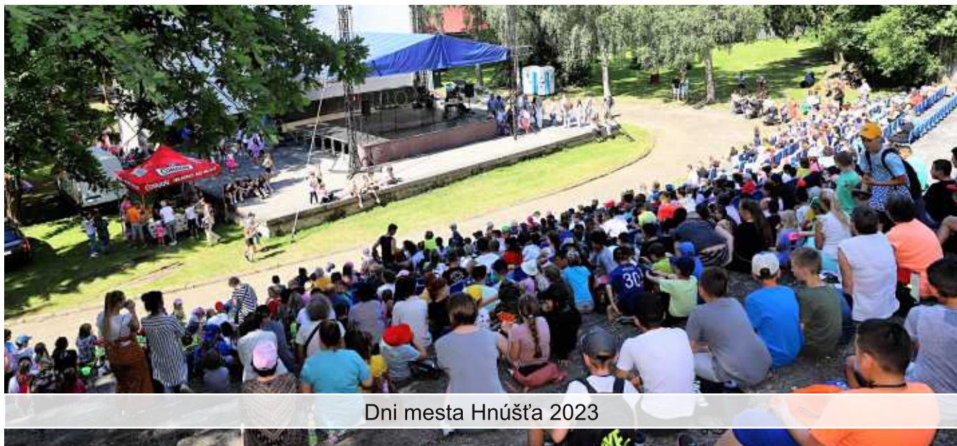
Dni mesta Hnúšťa 2023