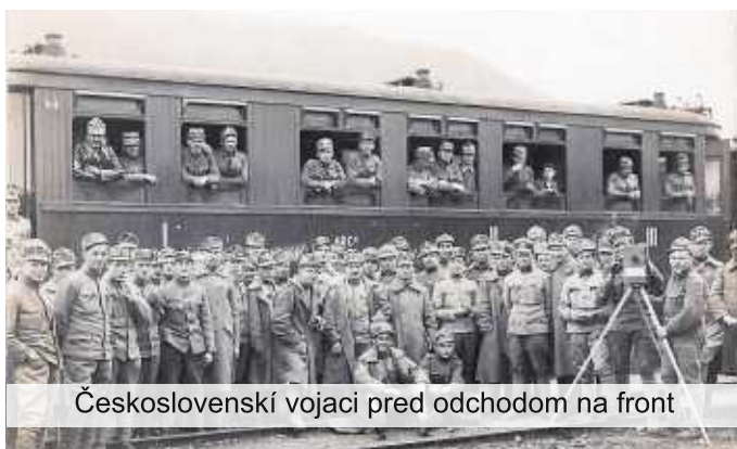
Československí vojaci pred odchodom na front