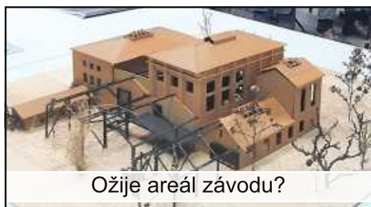
Ožije areál závodu?