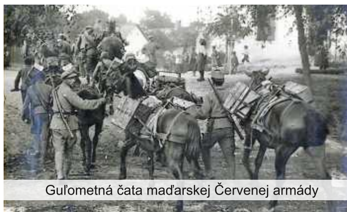
Gulometná čata maďarskej Červenej armády

Je tomu už 104 rokov, čo v našom okolí prebiehala dodnes zabudnutá vojna, ktorá za sebou zanechala mnoho obetí z radov vojakov, ale aj civilného obyvateľstva. Zatiaľ čo spomienky na Slovenské národné povstanie sú pomerne živé aj vďaka žijúcim pamätníkom, boje, ktoré tu prebiehali v roku 1919 sú pomerne neznámou kapitolou. Výraznou mierou k tomu prispel predchádzajúci režim, ktorý počas štyridsiatic rokov dezinterpretoval tieto udalosti a systematicky odstraňoval hmotné pamiatky na prebiehajúce boje, čo viedlo k takmer úspešnému vymazaniu vojny z historiografie. Vznik Československej republiky v roku 1918 nebol ľahký a svoju slobodu si museli Česi a Slováci vybojovať. Maďarsko sa nemienilo vzdať „Horných Uhier“, od prvého dňa vzniku Československej republiky, a tak bolo jasné, že bude dochádzať k možným stretom pri prevzatí moci novými správnymi orgánmi. Nikto vtedy netušil, že v roku 1919 vypukne vojnový konflikt, ktorý zasiahne značnú časť Slovenska. Boje o územie Slovenska vyvrcholili v júni 1919.