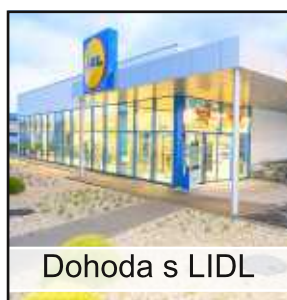
Dohoda s LIDL