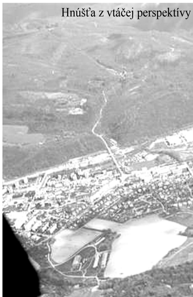
Hnúšť'a z vtácej perspektívy