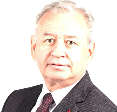
II. kvartál činnosti primátora