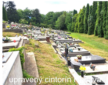
upravený cintorín Likier