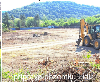
príprava pozemku Lidl