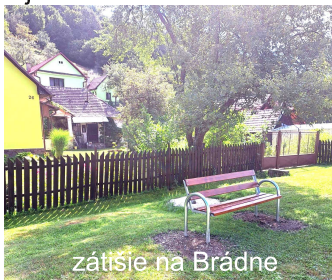
zátišie na Brádne