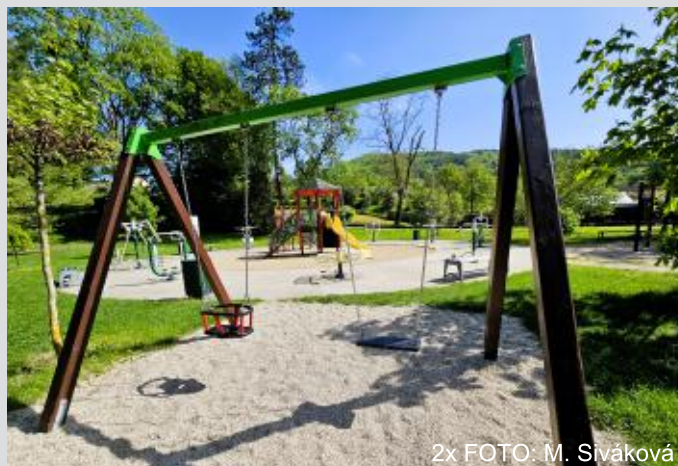
2x FOTO: M. Siváková