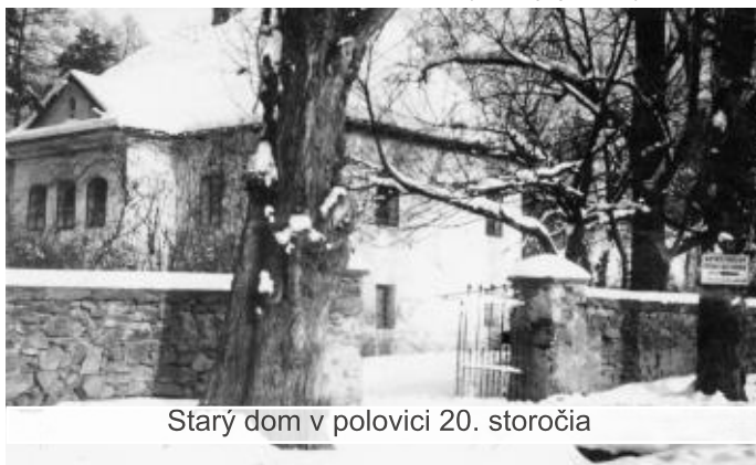
Starý dom v polovici 20. storočia