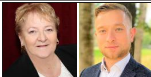
Predstavenie poslancov MsZ 2022-2026