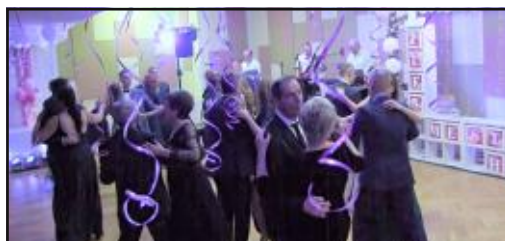
I. ples mesta Hnúšťa