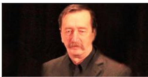
Blahoželáme k jubileu