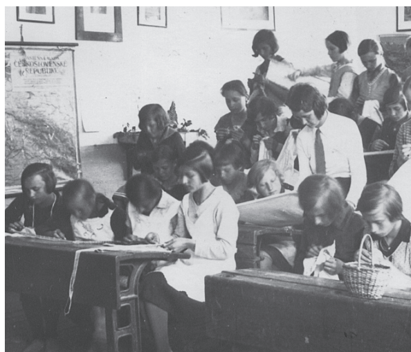
Dievčenské ručné práce v Ľudovej škole 1937

v priestoroch expozičnej miestnosti MsKS v Hnúšti.