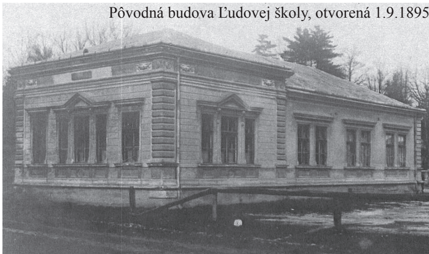
Pôvodná budova Ľudovej školy, otvorená 1.9.1895

kostole, v blízkosti pomníka Janka Francisciho Rimavského. Bola to prízemná budova a mala len tri triedy. Prvá trieda bola uprostred budovy, druhá na ľavej strane smerom k Rimave a tretia k ceste. (Rozmery učebných siení sú nasledovné: vo všetkých triedach je výška 4m, prvá trieda má