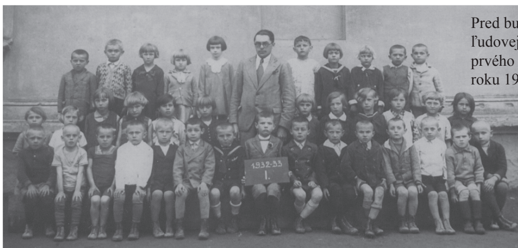
Pred budovou Obcej ľudovej školy stoja žiaci prvého ročníka v školskom roku 1932 - 1933.