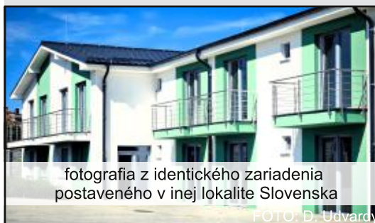
fotografia z identického zariadenia postaveného v inej lokalite Slovenska