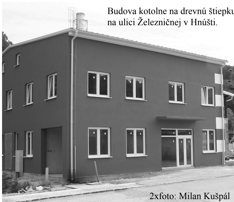
Budova kotolne na drevnú štiepku na ulici Železničnej v Hnúšti.

ktoré spoločnosť inštaluje v priebehu posledných týždňov. Navyše v priebehu tohto roku sa rozšíri aj využívanie biomasy, pretože kotolňa na Železničnej bude do príchodu zimy rozšírená o nový kotol. Vďaka tomu sa takmer 95% tepla bude vyrábať z obnoviteľných zdrojov, kde je výrazne vyššia cenová stabilita ako pri zemnom plynu. Cenová stabilita pri využívaní biomasy je podčiarknutá aj tým, že prevádzkovateľ centrálného systému vykurovania v Hnúšti, spoločnosť Rimavská energetická, s.r.o., patrí do energetickej skupiny Intech Slovakia, ktorá má vybudované vlastné výrobné a dopravné kapacity na spracovanie biomasy. Drevnú štiepku využívanú v Hnúšti si pripravuje vlastnými strojmi a pracovnými silami. Vďaka tomu dokáže výraznejšie ovplyvniť náklady spojené s obstaraním paliva, než by tomu bolo pri jeho nákupe na voľnom trhu. Navyše to prináša aj ďalší pozitívny efekt v oblasti zvýšenia zamestnanosti. Len v Hnúšti a okolí bolo vytvorených 10 nových pracovných miest. Spoločnosť Rimavská energetická predpokladá, že vďaka významným investíciám do zefektívnenia distribúcie tepla a do využívania obnoviteľných zdrojov energie, bude v najbližších rokoch cena tepla v Hnúšti stabilizovaná. Vonkajšie vplyvy na rast cien budú eliminované na minimálnu možnú úroveň a nie je potrebné sa obávať dramatických nárastov cien za teplo na vykurovanie a prípravu teplej vody.