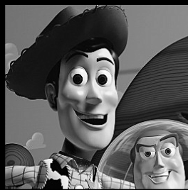
TOY STORY 3