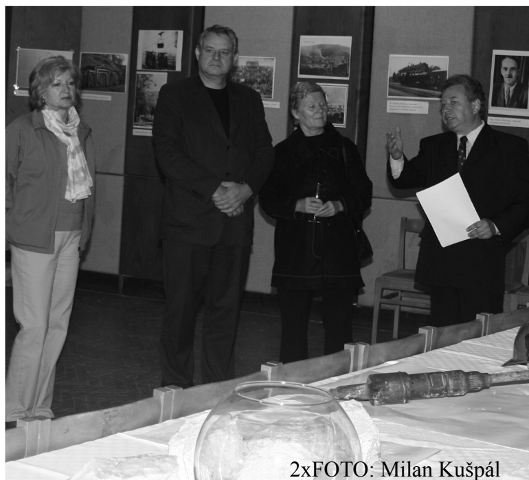
2xFOTO: Milan Kušpál