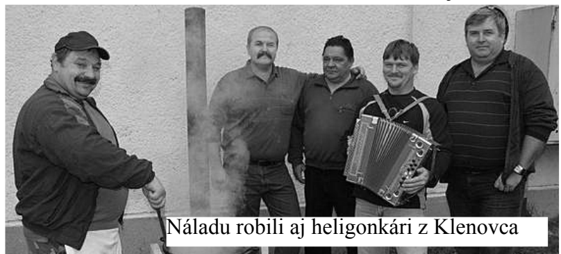
Náladu robili aj heligonkári z Klenovca