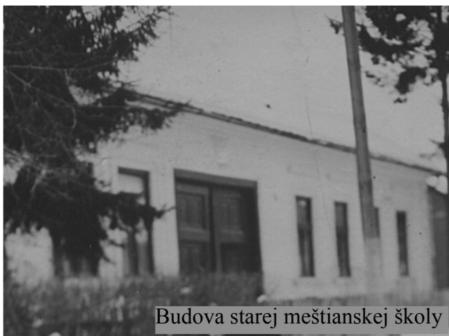
Budova starej meštianskej školy