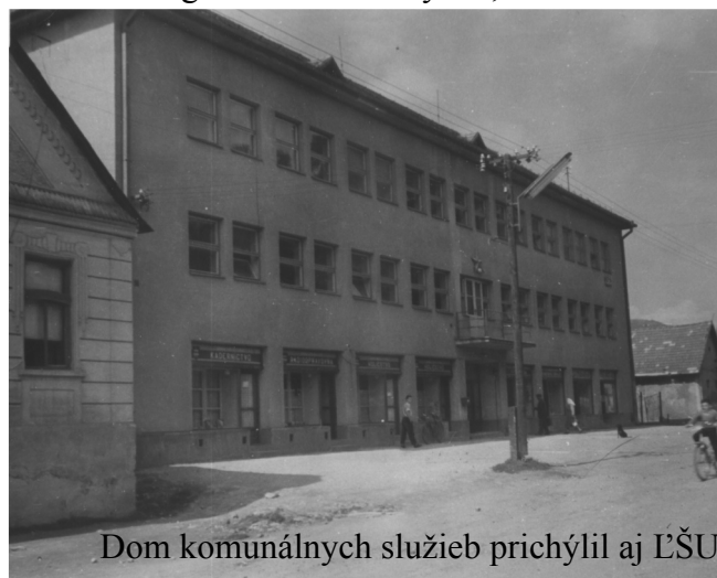
Dom komunálnych služieb prichýlil aj ĽŠU