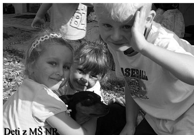
Deti z MŠ NB