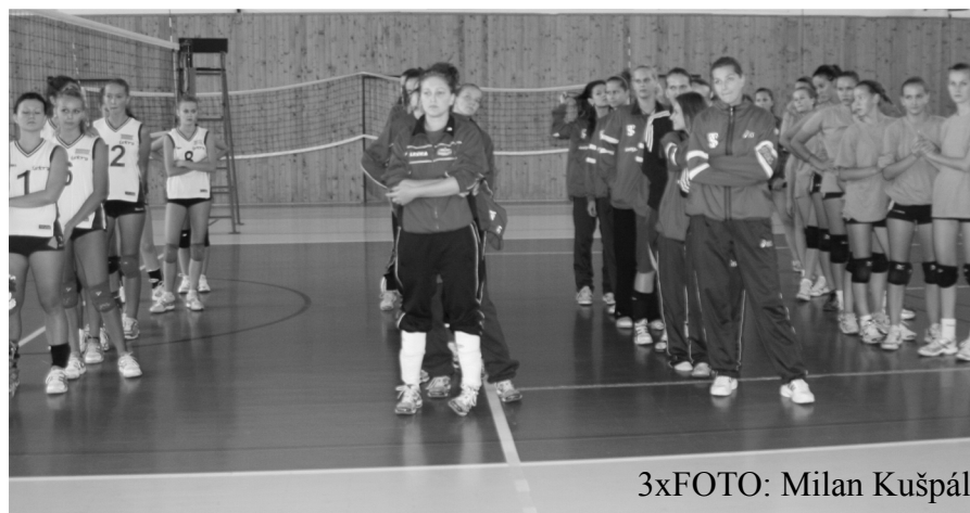
3xFOTO: Milan Kušpál