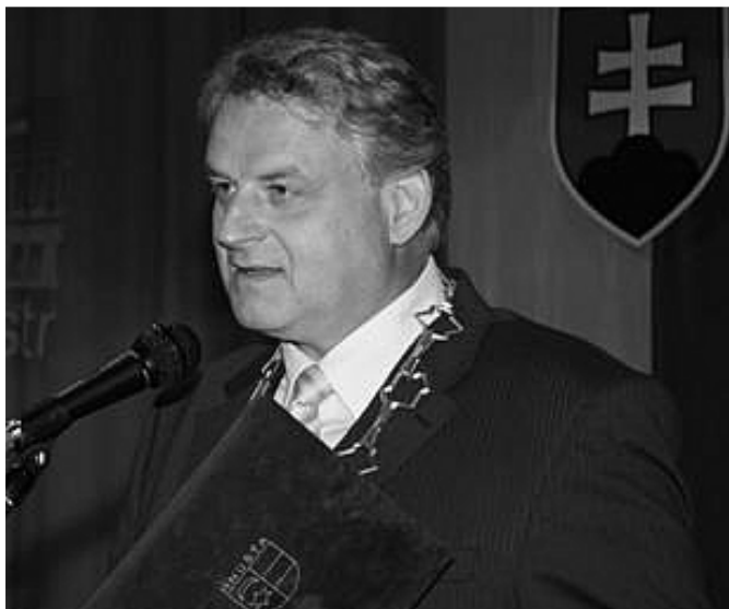
Primátor mesta pri slávnostnom príhovore