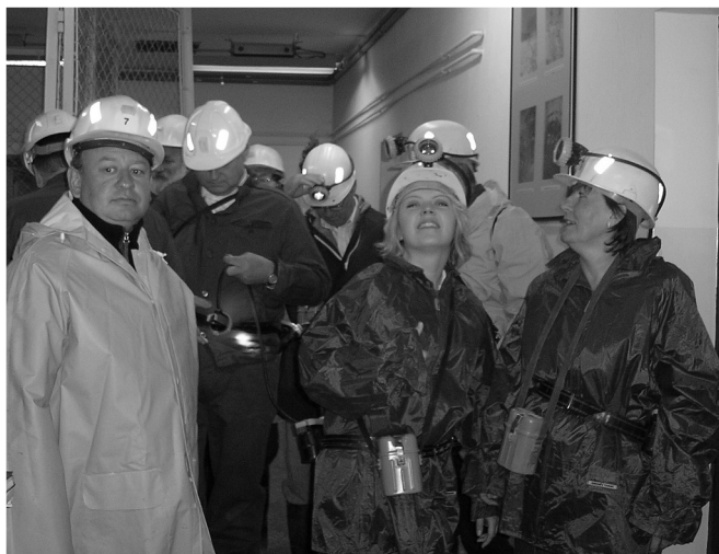
V programe pobytu bolo i sfáranie do 210 m hĺbky