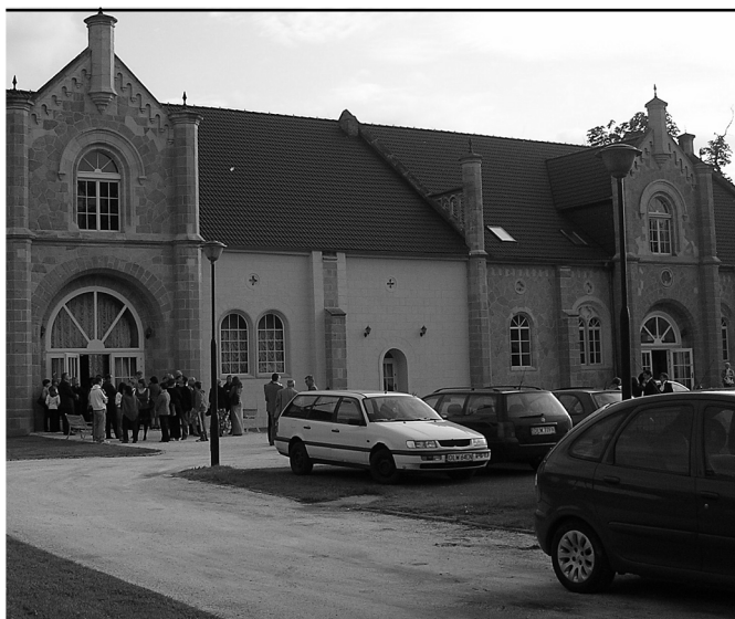
V priestoroch zámku Brumow