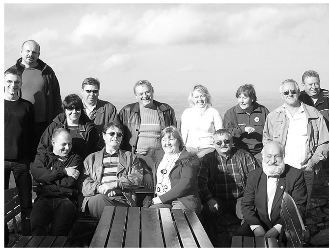
Spoločná fotografia z poľskej strany Jizerských hôr