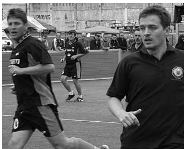
Z futbalových bojov o Pohár primátora

Agentúra AGRUM MUSIC sa ospravedľňuje všetkým divákovi koncertu Alphaville za oneskorený začiatok z technických príčin.