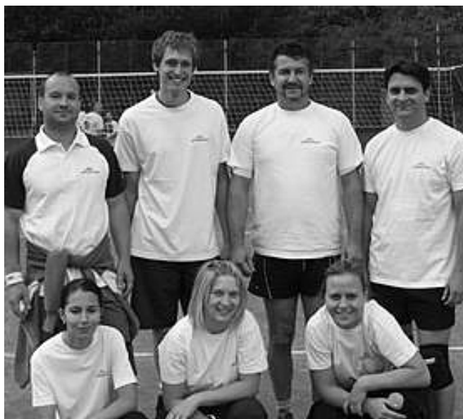
Vít'azné družstvo turnaja O štít mesta - Policajti RS