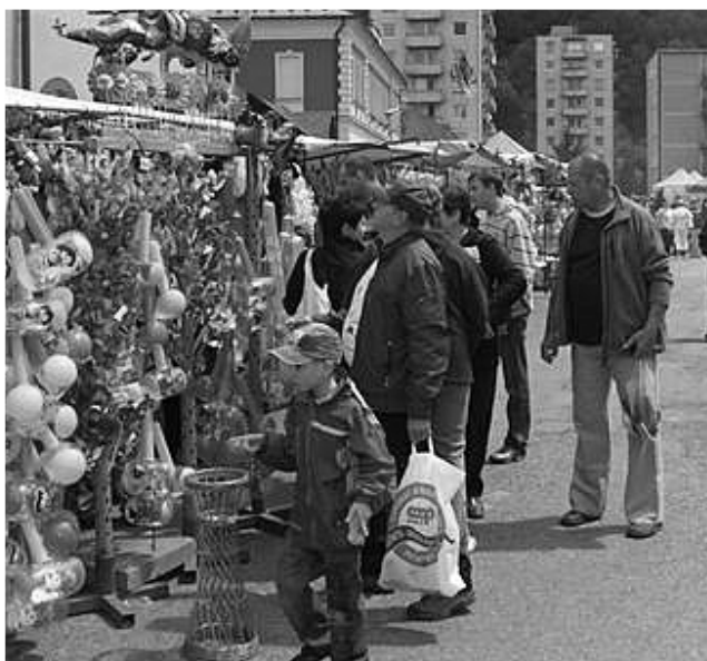
Jarmok asi zasiahla hospodárska kríza