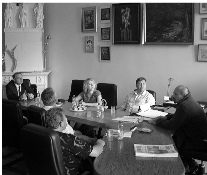
Prijatie u starostu okresu Lwóweckiego

Po podpísaní zmluvy o partnerstve a spolupráci na hnúšťanských dňoch mesta bolo potrebné potvrdiť zmluvu aj na strane partnera z Poľskej republiky. A tak delegácia vedená primátorom mesta, jeho zástupcom a prednostkou MsÚ navštívila v dňoch 31.5.-3.6. družobný okres Lwówecki v jeho meste Lwówek Śląski, kde v priestoroch zámku Brumow sa spečatila spolupráca v oblasti hospodárstva, turizmu, rozvoja infraštruktúry, kultúrnych a športových výmen ako aj ochrany prírodného bohatstva. Poší priatelia pripravili pre nich bohatý program: jazdu parným vlakom, návštevu bane na sádru, hasičské preteky v meste Wlen, návštevu sociálneho ústavu ako aj výstup na vrchol Stog Izerski vo výške 1 108 m. -mp-