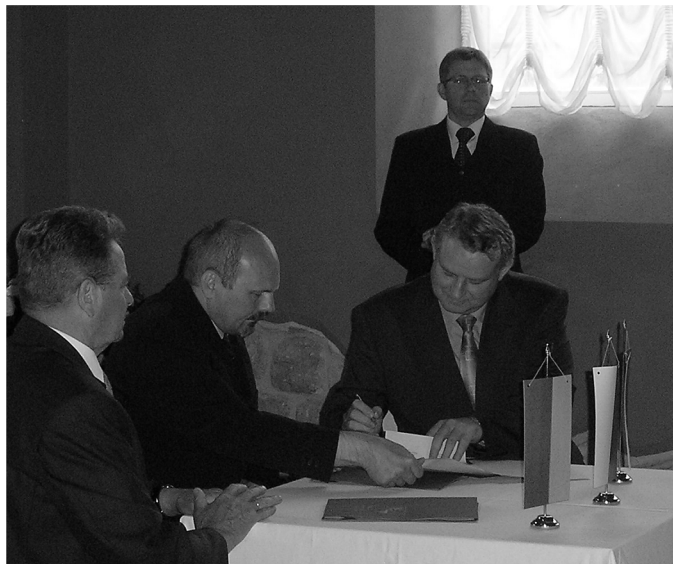
Partnerstvo sa uzatvorilo podpisom zmluvy