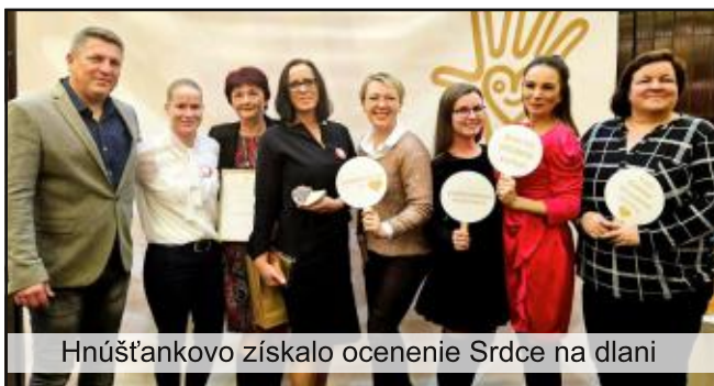
Hnúšťankovo získalo ocenenie Srdce na dlani