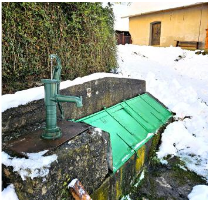
studňa v miestnej časti Polom