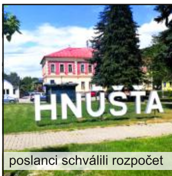
poslanci schválili rozpočet

Do aplikácie sa nemusíte registrovať, neposkytujete žiadne osobné údaje. Stiahnuť bezplatne si ju môžete do vášho smart telefónu prostredníctvom aplikácií Obchod Play , App Store alebo HUAWEI AppGallery . Pre viac informácií: www.aplikaciavobrazek.sk .