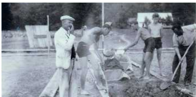
základy novej meštianky, rok 1942