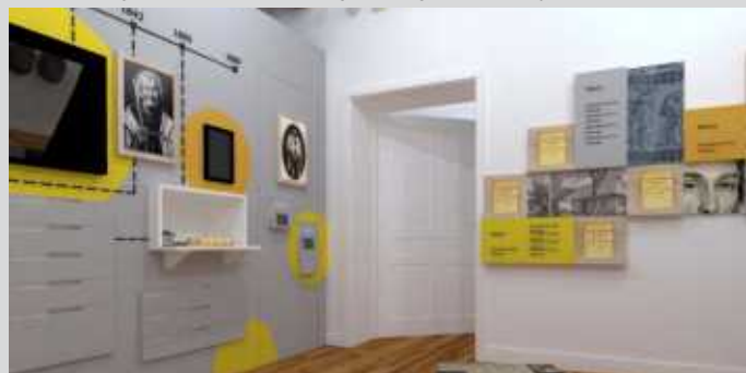
vizualizácia interiéru Petrivalského vily