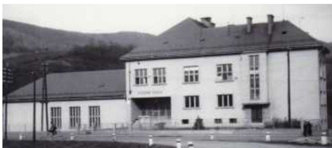
budova strednej školy, rok 1959