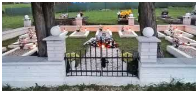
hroby padlých československých vojakov v Tisovci