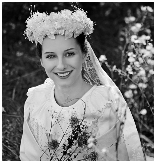
DDS Kukátko, foto: Petra Rapčanová