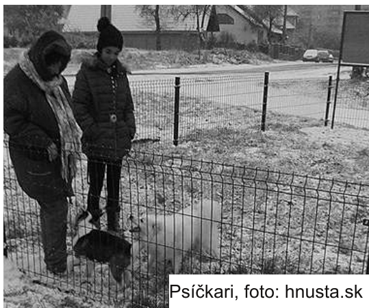
Psíčkari, foto: hnusta.sk