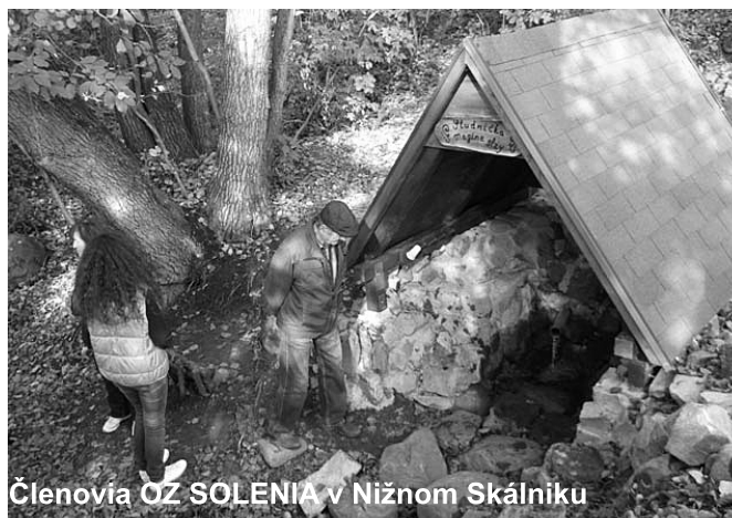
Členovia OZ SOLENIA v Nižnom Skálniku