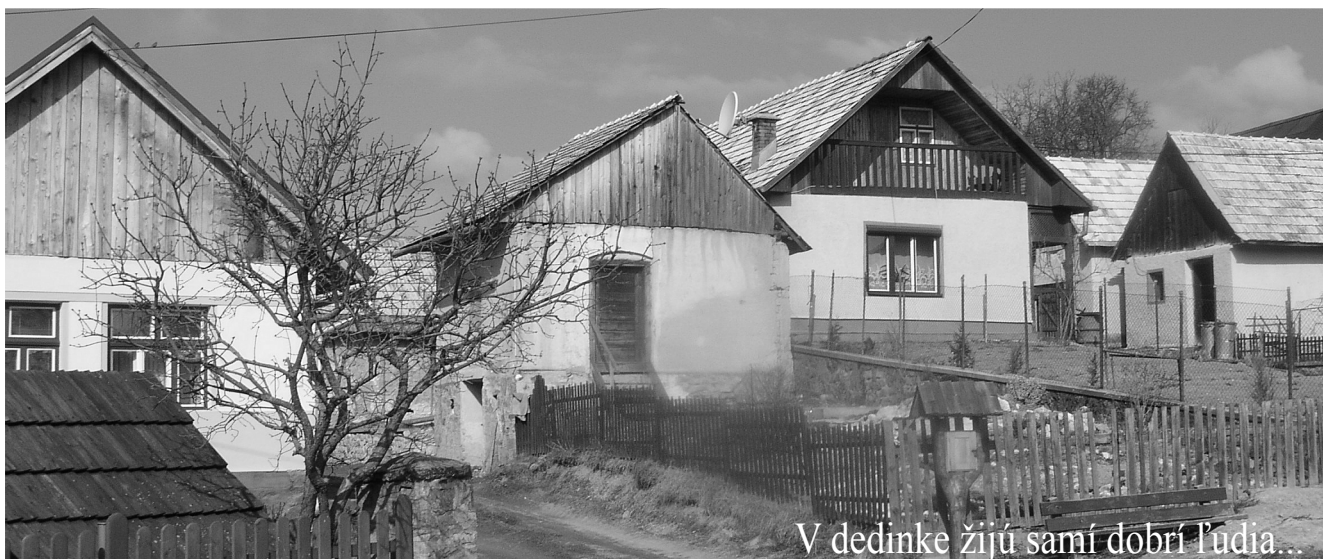
V dedinke žijú samí dobrí ľudia...