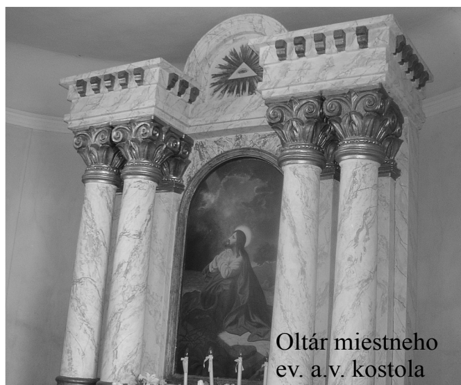
Oltár miestneho ev. a.v. kostola