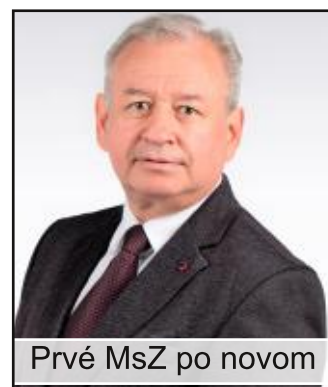
Prvé MsZ po novom