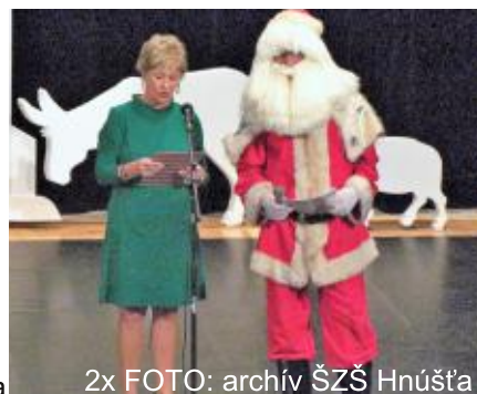
2x FOTO: archív ŠZŠ Hnúšťa