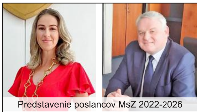
Predstavenie poslancov MsZ 2022-2026